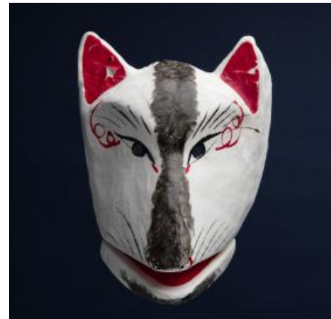
Fox Mask. Japan, Asia. ca 1960. Gift of the Girard Foundation Collection, Museum of International Folk Art

En México, los seres enmascarados representan personajes reales y míticos que expresan las creencias compartidas de una comunidad. Algunos de los personajes incluyen un jaguar o tigre, un anciano o viejito, un mono, un payaso. Las máscaras adoptan una variedad de formas; algunos son cascos que se usan en la parte superior de la cabeza, otros son máscaras de media cara que cubren la parte superior o inferior de la cara. Se usan máscaras en miniatura, de no más de seis pulgadas de ancho, así como máscaras que cubren solo la parte posterior de la cabeza. Algunas máscaras tienen mandíbulas móviles y algunas combinan formas humanas y animales.