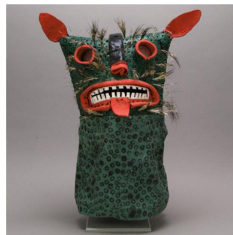
Tiger Mask. Mexico, North America. 1987. Museum of International Folk Art